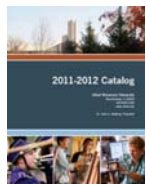
授業概要 (Course Catalog, Bulletin)